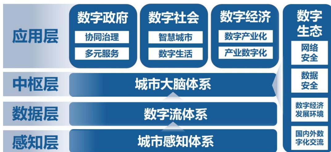
数字福州总体架构图

感知层： 感知层是整个体系的物理基础，是联系物理世界与数字世界的关键纽带，作为城市基础的网络传输资源和传感硬件资源终端，为城市提供高速传输承载和泛在感知能力，以高速泛在、天地一体、云网融合、智能敏捷、绿色低碳、安全可控等为指导，统筹布局感知设施建设，打造安全可靠的基础环境，形成全域一体的数字城市感知神经网络。